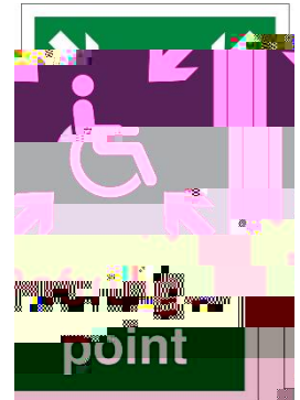
Dyma symbol y Mannau Aros Diogel

Mae gan y rhan fwyaf o Fannau Aros Diogel systemau cyfathrebu sy'n cysylltu â'r adran Ddiogelwch er mwyn i bobl fedru aros yn y Man Aros Diogel yn disgwyl am gyfarwyddiadau pellach. Dylech hefyd eu defnyddio, er enghraifft, os yw'r lifft wedi torri a'ch bod chi yn methu â gadael y llawr hwnnw.